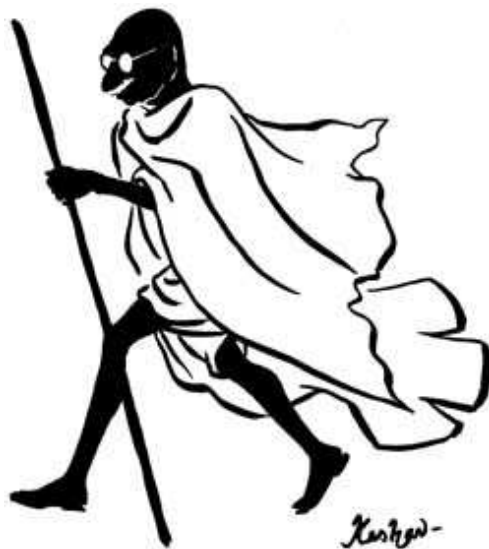
(Presa da: www.cs.wisc.edu )

scopo di convertire. La fede non ammette di essere raccontata. Deve essere vissuta, allora si racconta da sé [...] Non conosco peccato più grande di quello di opprimere gli innocenti in nome di Dio [...] Credo ciecamente nella mia religione. Voglio morire per essa. Ma è una mia faccenda personale. Lo Stato non c'entra". La profondità della laicità gandhiana risalta ancora di più in tempi come quelli di oggi dove i fanatismi e i poteri religiosi si contendono le anime e i corpi. L'affermare di essere pronti a morire per la propria religione, ma nello stesso tempo credere che questa religione non esaurisce la verità, perché vere lo sono anche le altre, significa aver raggiunto la più alta forma di laicità possibile, quella che relativizza tutte le religioni monoteistiche e non. Fare della propria fede non uno strumento di propaganda ma un esempio di vita, perché la fede ha solo bisogno di essere testimoniata, significa rifiutare la violenza fisica e morale che le religioni monoteistiche o meno hanno prodotto nella storia. Rifiutare il clericalismo e la religione di Stato, complice o dispensatrice di potere, per ricondurla alla libera scelta personale di ciascuno, vuol dire fare della laicità il proprio credo interiore. Se le cose stanno così, chiediamoci allora che cosa era la religione per Gandhi, quale funzione aveva nella economia del suo pensiero filosofico, quale concezione aveva di Dio, visto che nei suoi scritti Dio ritorna continuamente come