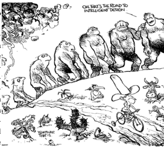
trad. "beh, quella è la strada del disegno intelligente!"